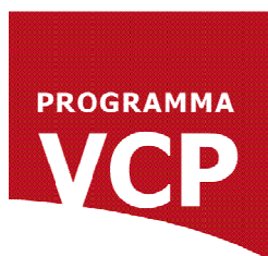
Marieke Bauwens Programma VCP

Datum: donderdag 29 september Tijd: 13.00 – 15.30 uur Plaats: Paviljoen Te Werve Huys de Wervelaan 110 2283 TM Rijswijk (zie voor routebeschrijving: www.paviljoentewerve.nl )